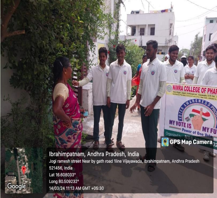
Ibrahimpattam, Andhra Pradesh, India Jogi ramesh street Near by gath road 1line Vijayawada, Ibrahimpattam, Andhra Pradesh 521456, India Lat 16.608033° Long 80.509232° 14/03/24 11:13 AM GMT +05:30